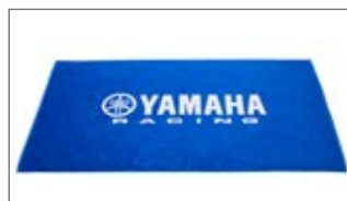
NIEBIESKI RĘCZNIK PLAŻOWY N18-HR001-2E-00