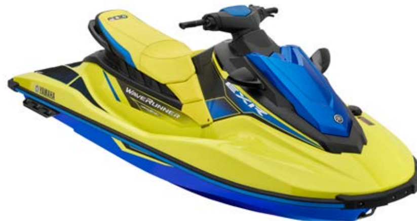
Lime Yellow with Azure Blue