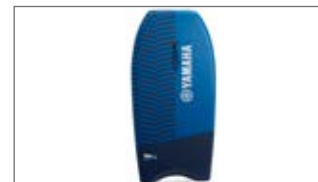
DESKA DO PŁYWANIA DLA DZIECI N18-GN021-E0-00