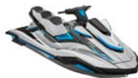
FX Cruiser HO