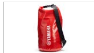
DUŻA CZERWONA NIEPRZEMAKALNA TORBA T18-HD009-C0-00