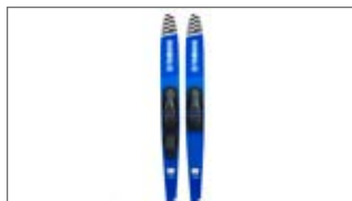
NIEBIESKIE NARTY WODNE N18-GN018-E0-00