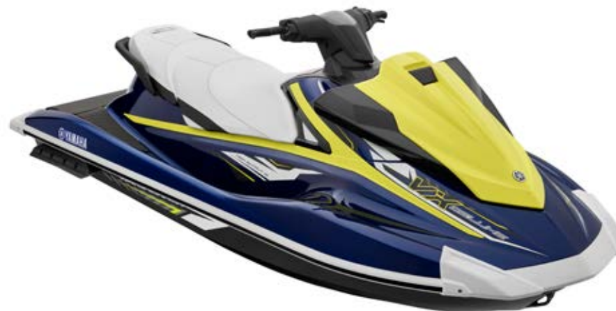
Yacht Blue with Lime Yellow