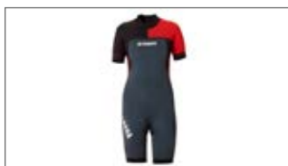
DAMSKA PIANKA KRÓTKA D18-AL203-B7 0S-0M-0L-1L