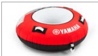
CZERWONE JEDNOOSOBOWE KOŁO DO HOLOWANIA TYPU BANAN N18-GN012-C0-00