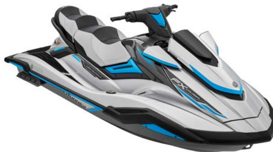
Silver with Carbon