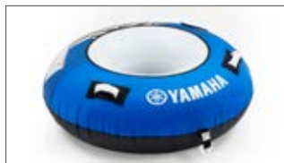
CZERWONE JEDNOOSOBOWE KOŁO DO HOLOWANIA TYPU BANAN N18-GN012-E0-00