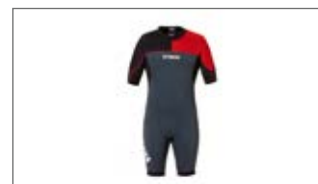
PIANKA MĘSKA KRÓTKA D18-AL103-B7 0S-0M-0L-1L-2L