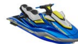
FX Cruiser SVHO