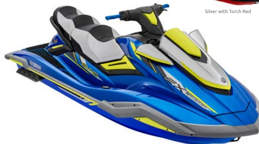
Azure Blue with Lime Yellow