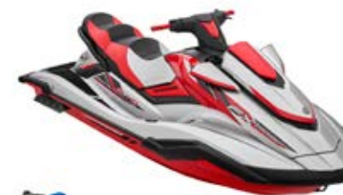
Silver with Torch Red