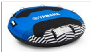
NIEBIESKA DWUOSOBOWA MATA DO HOLOWANIA N18-GN014-E0-00