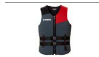
MĘSKA KAMIZELKA D18-AJ114-B7 0S-0M-0L-1L-2L