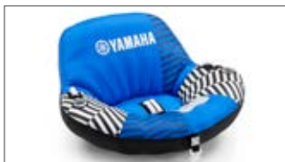
NIEBIESKIE KRZESŁO DO HOLOWANIA – DWUOSOBOWE N18-GN017-E0-00