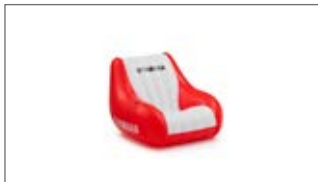
POMPOWANE KRZESŁO CZERWONE N18-GN019-C0-00