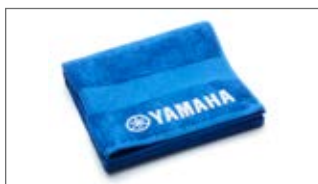
NIEBIESKI RĘCZNIK KĄPIELOWY N18-GR012-E0-00