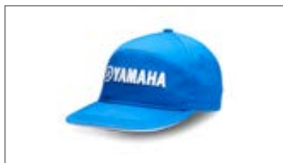
NIEBIESKA CZAPKA WAVERUNNER N18-GH100-E0