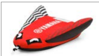
CZERWONA JEDNOOSOBOWA MATA HOLOWANA ZE SKRZYDŁAMI N18-GMP16-C0-00