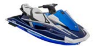
VX Cruiser HO