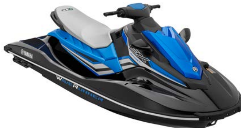
Black with Azure Blue

Skuter ten dysponuje płynnie rozwijaną, niezawodną mocą i wszystkimi udogodnieniami niezbędnymi do dobrej zabawy na wodzie — czytelnym wyświetlaczem, mechanicznym biegiem wstecznym, dwoma lusterkami, platformą rufową z uchwytem, zaczepem holowniczym oraz przestronnymi schowkami.