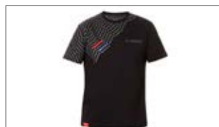
T-SHIRT WAVERUNNER B18-GT101-B0 1S-0S-0M-0L-1L-2L-3L