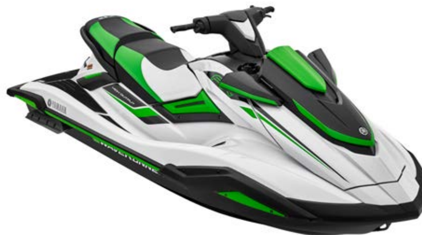
White with Green