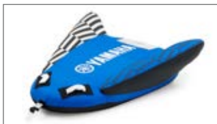
NIEBIESKA JEDNOOSOBOWA MATA HOLOWANA ZE SKRZYDŁAMI N18-GN016-E0-00