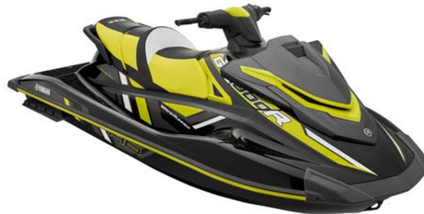
Black with Carbon