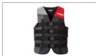
KAMIZELKA RATUNKOWA Z 4 ZAPIĘCIAMI D18-AJ314-B7 1S-0S-0M-0L-1L-2L-3L