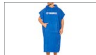
RĘCZNIK TYPU PONCHO DLA DOROSŁYCH N18-HR313-E0-00 JEDEN ROZMIAR