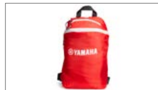
PLECAK SKŁADANY T18-HB00C-01-00