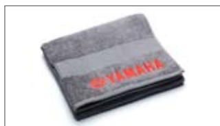
SZARY RĘCZNIK KĄPIELOWY N18-GR012-F0-00