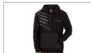
BLUZA Z KAPTUREM WAVERUNNER B18-GT107-B0 1S-0S-0M-0L-1L-2L-3L