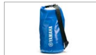
DUŻA NIEBIESKA NIEPRZEMAKALNA TORBA T18-HD009-E0-00