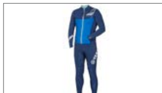
PIANKA MĘSKA DŁUGA D17-AL1E0-E0 0S-0M-0L-1L-2L-3L