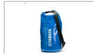
MAŁA NIEBIESKA TORBA NIEPRZEMAKALNA T18-HD010-E0-00