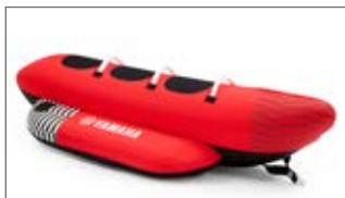
CZERWONY BANAN TRZYOSOBOWY N18-GN015-C0-00