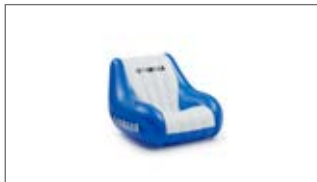
POMPOWANE KRZESŁO NIEBIESKIE N18-GN019-E0-00