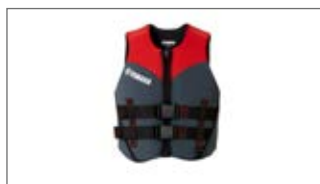
DAMSKA KAMIZELKA D18-AJZ14-B7 0S-0M-0L-1L-2L