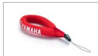
PŁYWAJĄCE KÓŁKO NA KLUCZE N18-NL003-C5-00