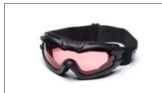
OKULARY OCHRONNE WAVERUNNER RACE Z RÓŻOWYM WIZJEREM N17-AV004-B7-00