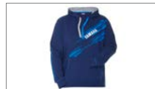
BLUZA Z KAPTUREM WAVERUNNER RACE K17-AT106-E4 1S-0S-0M-0L-1L-2L-3L