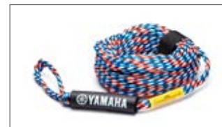
LINA DO HOLOWANIA N18-GN013-C4-00