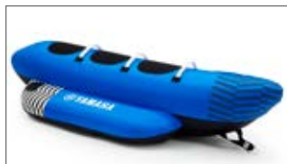
NIEBIESKI BANAN TRZYOSOBOWY N18-GN015-E0-00