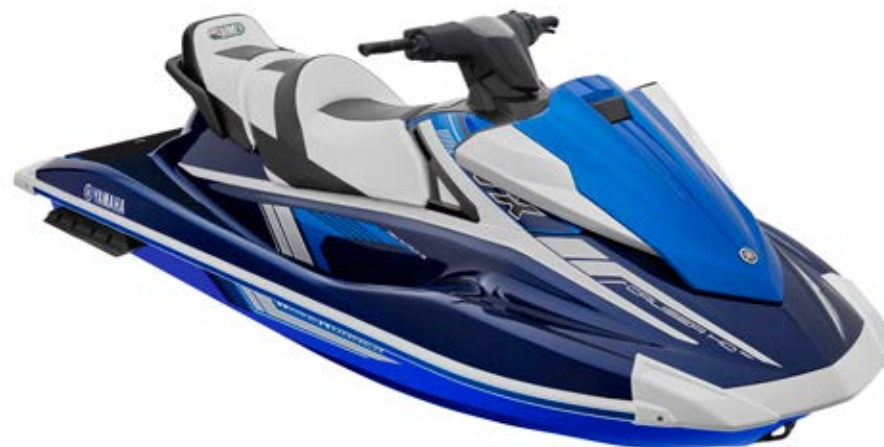
Yacht Blue with Azure Blue