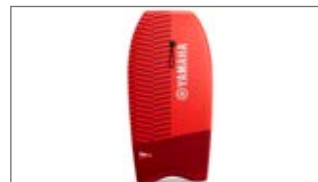
DESKA DO PŁYWANIA DLA DZIECI N18-GN021-C0-00