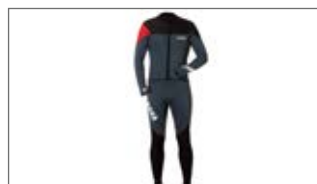
PIANKA MĘSKA DŁUGA D18-AL102-B7 0S-0M-0L-1L-2L-3L