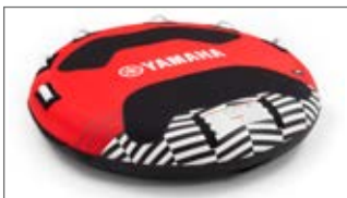
CZERWONA DWUOSOBOWA MATA DO HOLOWANIA N18-GN014-C0-00