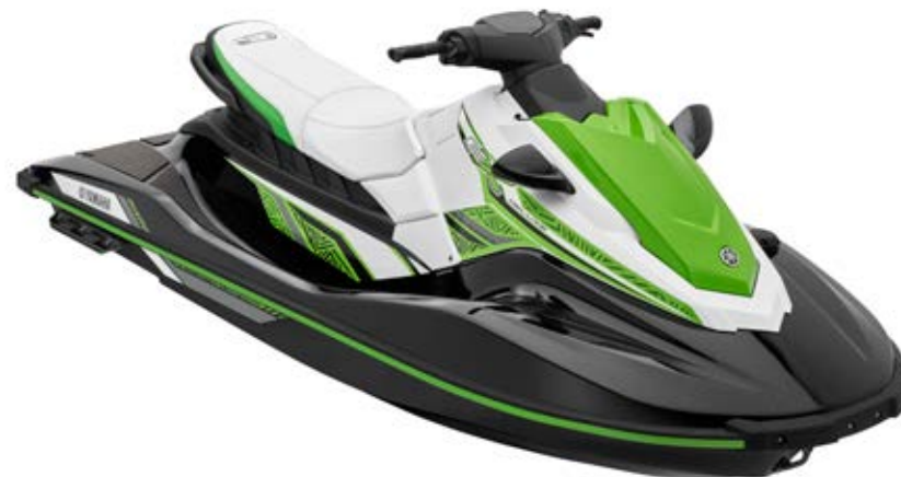
Black with Lime Green

Jedną z nich jest rewolucyjna technologia Ride®, czyli intuicyjny i prosty w obsłudze system sterowania gwarantujący niezwykłą przyjemność z pływania, zapożyczony z najbardziej zaawansowanych skuterów wodnych Yamahy.