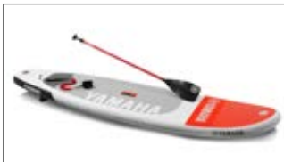
DMUCHANA DESKA DO PŁYWANIA Z WIOSŁEM YMM-H17SU-PP-C3