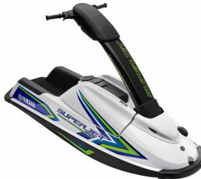
White with Blue

Jedyna w swoim rodzaju ergonomiczna konstrukcja, z kolumną kierownicy z odciążeniem sprężynowym, wymuszająca na użytkowniku zajęcie bardziej agresywnej, pochylonej do przodu pozycji, sprzyjającej ostrym zakrętom. Twój SuperJet czeka na Ciebie! Pamiętaj: skuter jest przeznaczony wyłącznie do wyścigów na zamkniętym akwenie i użytku zawodniczego.