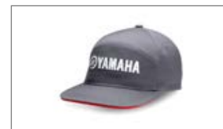
SZARA CZAPKA WAVERUNNER N18-GH100-F0