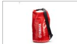
MAŁA CZERWONA TORBA NIEPRZEMAKALNA T18-HD010-C0-00