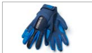
RĘKAWICE WYŚCIGOWE WAVERUNNER D17-AN103-E0 1S-0S-0M-0L-1L-2L