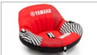
CZERWONE KRZESŁO DO HOLOWANIA – DWUOSOBOWE N18-GN017-C0-00