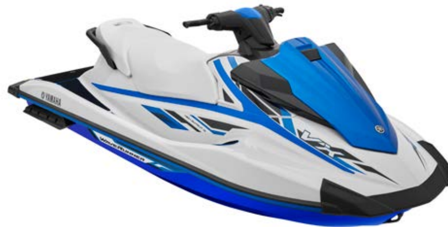
White with Azure Blue

VX zapewnia satysfakcjonujące osiągi i liczne praktyczne rozwiązania w bardzo przystępnej cenie. Żaden inny skuter wodny nie oferuje tak wiele!