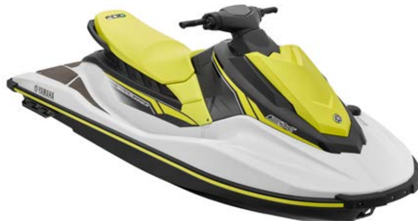
White with Lime Yellow

EX oferuje dużą moc w połączeniu z wysoką kulturą pracy i niezawodnością oraz wszystkie niezbędne elementy, których potrzebujesz na wodzie — poczynając od czytelnego wyświetlacza i uchwytów, a kończąc na zaczepie holowniczym i przestronnych schowkach.