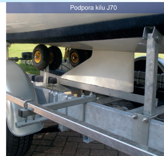
Podpora kilu J70

Seria z podwójn. osi MP2000 / MP2300 / MP2700 / MP3500 No no 1420 - 2740 kg Długo 520 - 755 cm